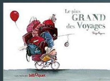
« Le plus grand des voyages » de Soufi