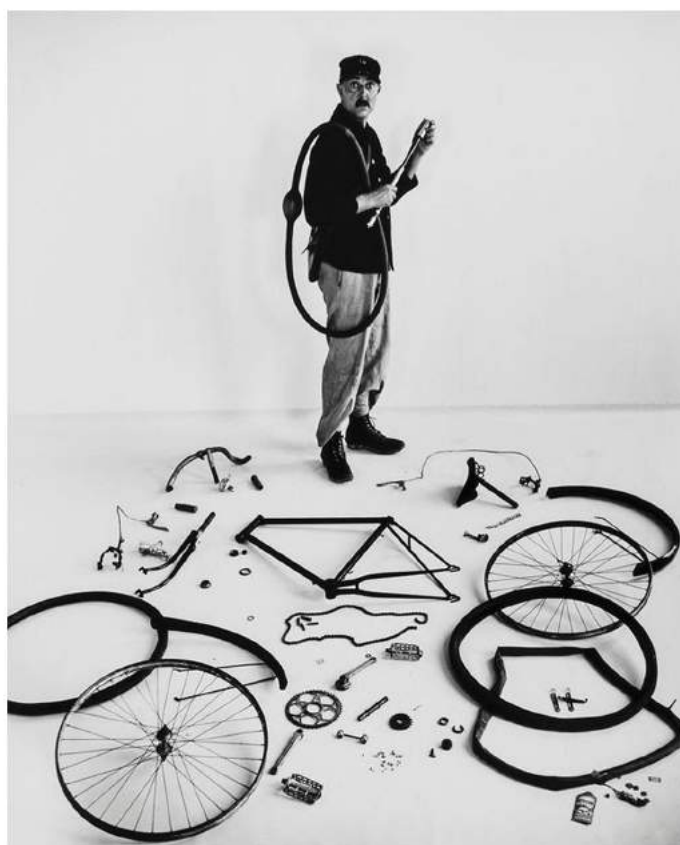
L'école des facteurs, Jacques Tati

Un espace circulaire de 3m de diamètre en forme de rustine, un lampadaire, une borne kilométrique, un vélo déglingué en pièces détachées et quelques accessoires.